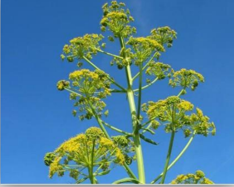
Çakşır Otu Ferula