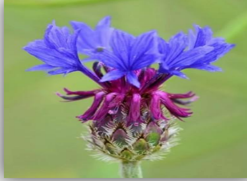
Peygamber Çiçeği Centaurea kilaea